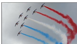
La Patrouille de France

L'après-midi a été consacrée à la visite de l'ensemble du salon et nous avons pu assister aux nombreuses démonstrations en vol inaugurées par la Patrouille de France :