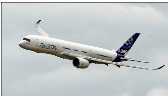
Première présentation au public de l'A350 en vol d'essai en provenance de Toulouse à survolé le Bourget